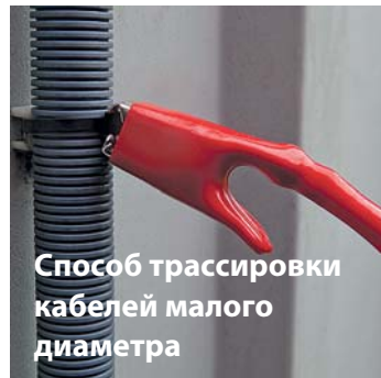
Способ трассировки кабелей малого диаметра