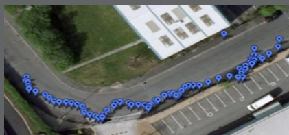
Обработка данных Google Earth™