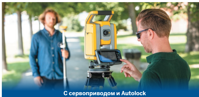
С сервоприводом и Autolock